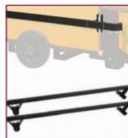
02AC845 / 02AC855 / 02AC865