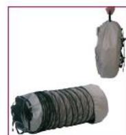
02AC563 / 02AC564 / 02AC566 / 02AC567 / 02AC568