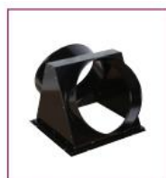
02AC842 / 02AC852 / 02AC862