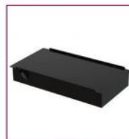
02AC847 / 02AC857 / 02AC867