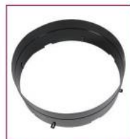
02AC744 / 02AC764