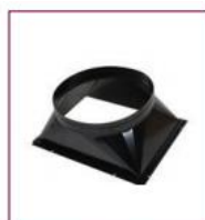
02AC841 / 02AC851 / 02AC861