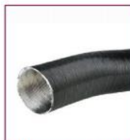
02AC797 / 02AC798