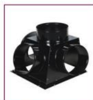
02AC843 / 02AC853 / 02AC863